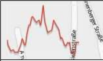
Höhenprofil 3 KM